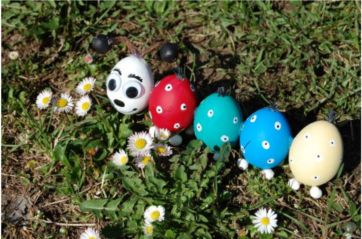
Housenka na procházce.