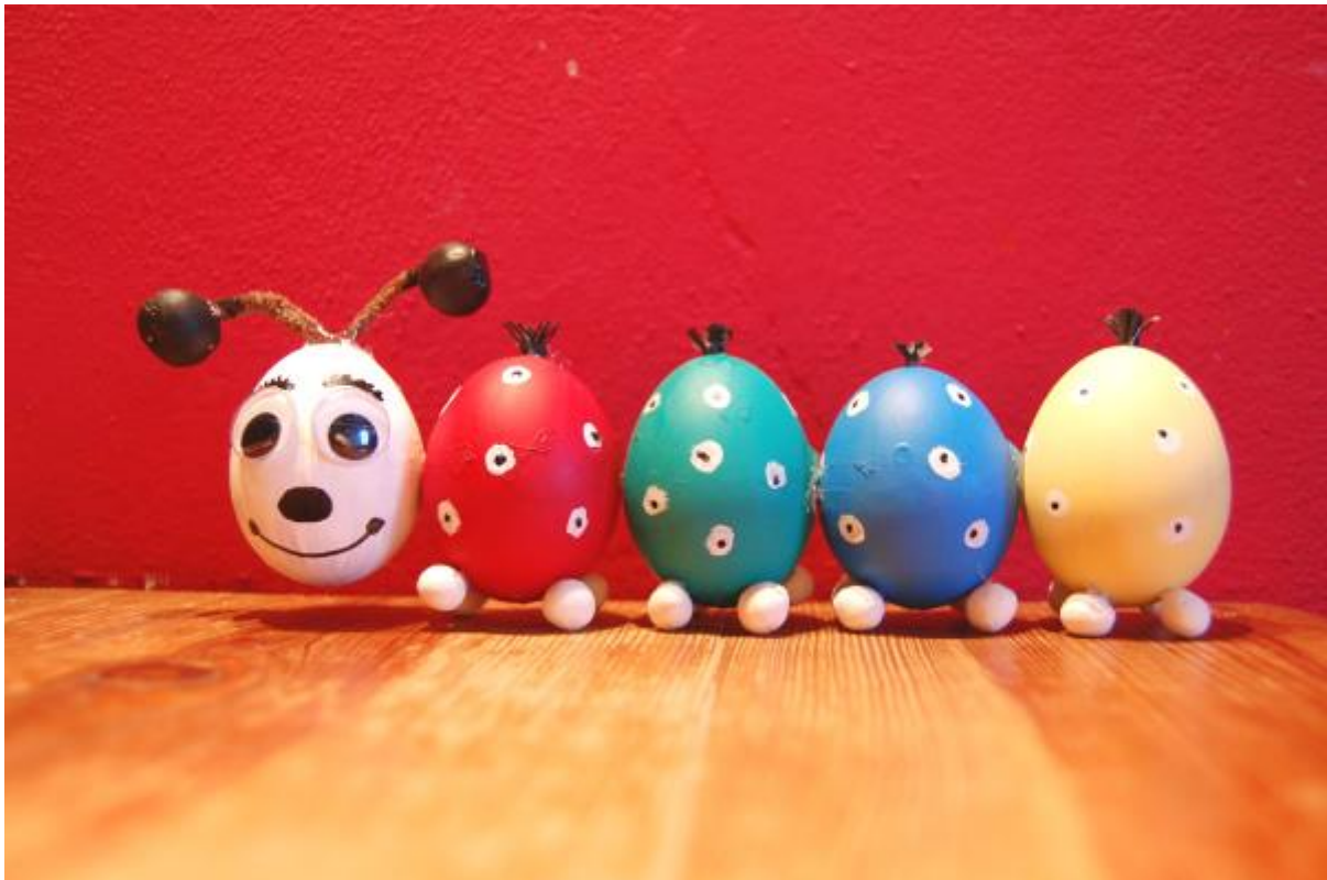
Na zaschlé barvy (kromě bílého vajíčka) uděláme bílé puntíky a do nich tuší černé tečky. Nožičky - na spodní část každého barevného vajíčka nalepíme tavnou pistolí čtyři korálky nebo kuličky ze samotvrdnoucí hmoty. Štětinky - do díry v horní části vajíčka vložíme smotaný a jemně nastříhaný proužek černého papíru. Hlavička (bíle nabarvené vajíčko) - špičkou špejle namočenou v černé tuši nakreslíme pusinku, nosánek a obočí. Poté nalepíme očička (nebo je můžeme také tuší namalovat). štětinatý drátek přehneme na půl a na každý konec nalepíme dřevěný korálek (nebo korálek ze samotvrdnoucí hmoty, který také natřeme na černě). Tím jsme vytvořili tykadla, která nalepíme tavnou pistolí do horní díry v hlavičce. Všechna vajíčka k sobě přilepíme tavnou pistolí.